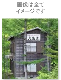
画像は全てイメージです