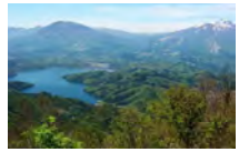
大明神岳からの眺望

登山口からトレイルの南の基点・斑尾山頂まで一気に登り詰めます。途中、天気が良いと開田山脈全容を眺めることができ、また山頂近くの大明神岳からは野尻湖や北五岳、火打山の他、遠く北アルプスまで望むことができます。万葉峠～袴岳間の美しいブナとタケカンバの森も見所です。