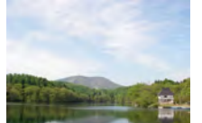
斑尾山を湖面に映し出す希望湖

ブナ林、湿原、湖と見どころが満載で、高低差の少ない歩きやすいトレイルが続きます。赤池から沼の原湿原までは気持ちのいいブナ林を歩きます。そこから信越トレイル本線を離れ、沼の原湿原トレイルへ。本線に戻ってからは左手には妙高山、快晴の日には日本海まで望める眺望ポイントを通り、斑尾山を背後に捉える希望湖まで歩きます。