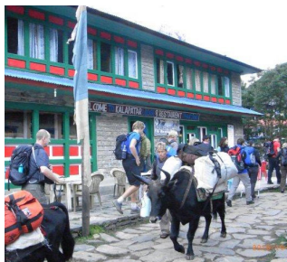
《エベレスト展望ヒマラヤトレッキング10日間》